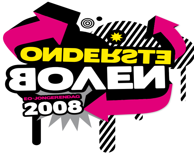
Figuur 1. Logo EO-Jongerendag